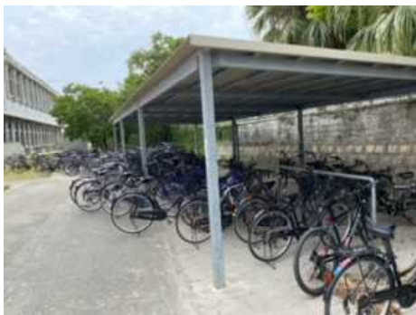
自転車置き場…あふれています

本校は校区が広く、地域・保護者の要請により自転車通学を認めています。そのため、毎年1年生を対象に、交通安全の意識を高めて安全な自転車の乗り方や交通安全意識を高めてもらうことを目的として、糸満警察署、糸満地区交通安全協会の協力のもと「交通安全教室」を実施しております。